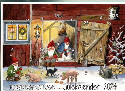
Motiv 1, Julekveld på gården

Siste frist for innsending av materiell er 23. oktober 2024!