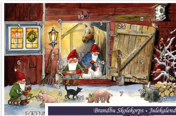
Forside motiv nr. 1

Vi har et bredt utvalg av gevinster til en hyggelig pris.