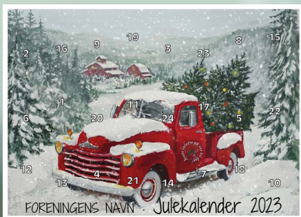
Motiv 5, Årets juletre