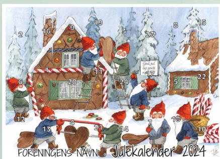
Motiv 2, Nissen bygger