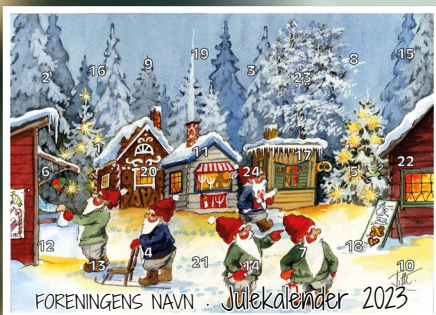
Motiv 4, Julemarked