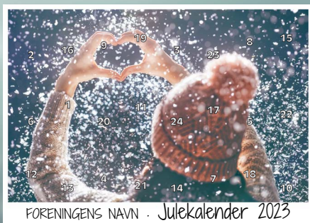
Motiv 6, Julemagi