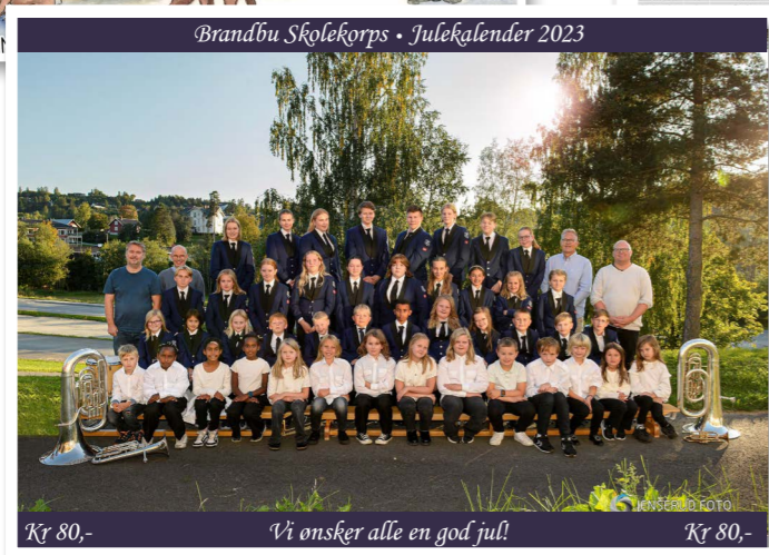
Eget motiv Tillegg i pris på kr 3 500,-