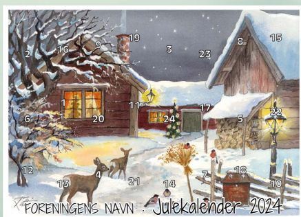
Motiv 3, En fredfull kveld